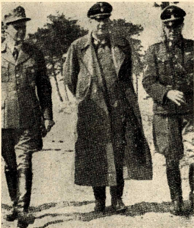
Il Gauleiter Rainer governò Trieste quando fu incorporata nel Reich

Guidi, Barracu e Mazzolini solleva con il plenipotenziario tedesco Rahn alcuni problemi interessanti l'amministrazione repubblicana, tra cui la questione delle «zone d'operazione». «Buffarini — scrive Deakin sulla base dei documenti segreti in possesso degli archivi inglesi — chiese un chiarimento della situazione nei "territori delle Prealpi e del Litorale Adriatico", amministrati da Gauleiter tedeschi. "Noi abbiamo temporaneamente rinunciato all'esercizio assoluto e totalitario della nostra sovranità per esigenze militari o politiche", ma fiduciosi di rientrare alla fine della guerra "nell'esercizio della... sovranità". Graziani espone come gli fosse stato difficile avere contatti diretti con le unità militari italiane di stanza nel Veneto. Dopo una lunga controversia sull'opera di "snazionalizzazione" compiuta dai tedeschi in quelle province, Rahn dichiarò di non credere "per ora possibile il ristabilimento della completa sovranità italiana in quelle zone... Ci sono oggi diecimila sloveni che combattono contro le bande di Tito; ci sono unità croate che fanno altrettanto. Essi... non lo farebbero sotto la guida italiana. Bisogna considerare questi dati psicologici per rendersi conto di quanto sia necessario mantenere queste popolazioni nell'attuale regime... Una soluzione radicale non è per ora possibile". La conferenza si chiuse con la raccomandazione di Rahn "di non sollevare la questione della zona delle Prealpi e del Litorale Adriatico"».